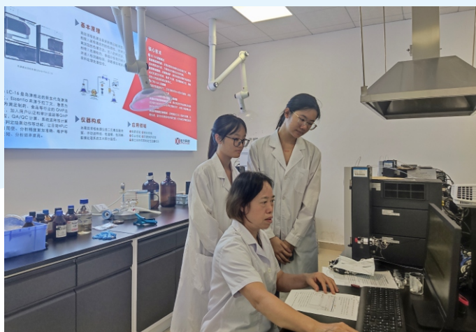
讲解高效液相色谱仪