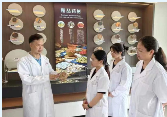
中药材鉴定课程讲授现场